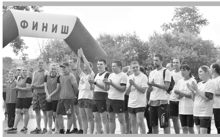
Цех № 4: праздновали победу под дождём.