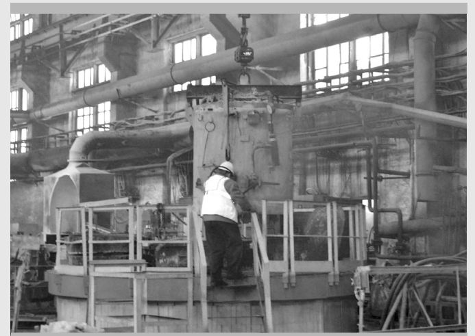
Печь ПНР уже выполняет план