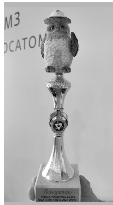
Сова – кубок победителей