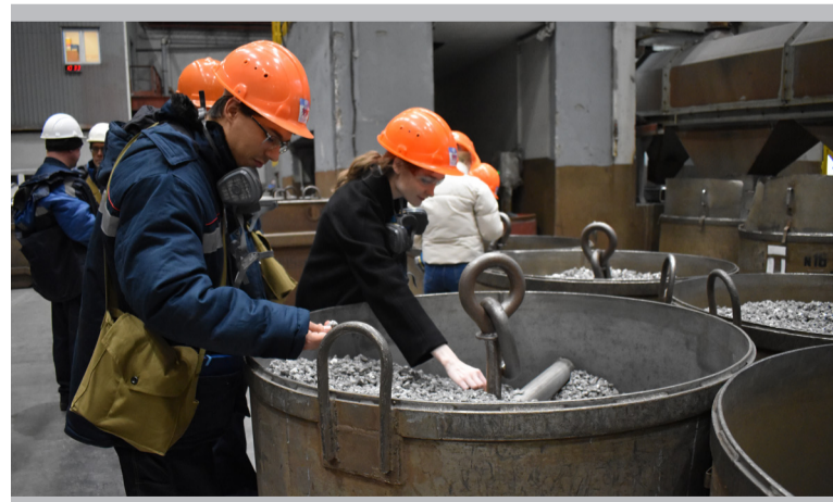
Можно быть отличником и всё прочитать о своей профессии, но по-настоящему узнаешь её, когда погружаешься в живое производство.