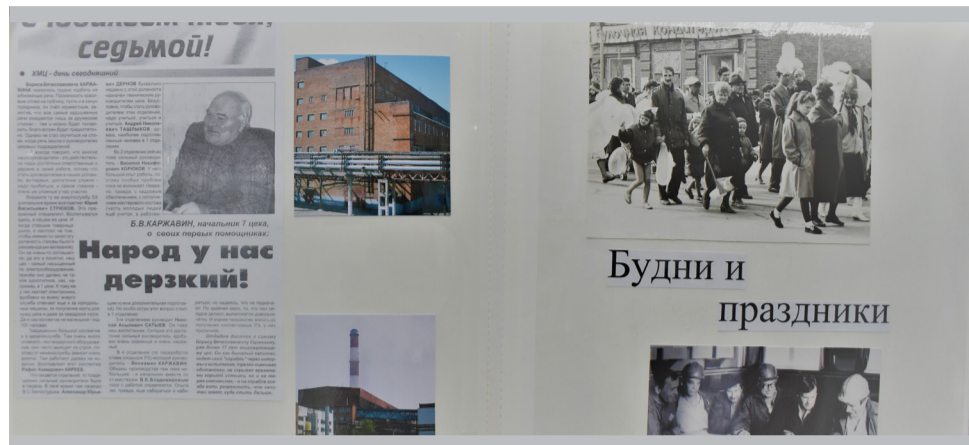
Цех № 7. «Историческое» единство рабочей и общественной жизни