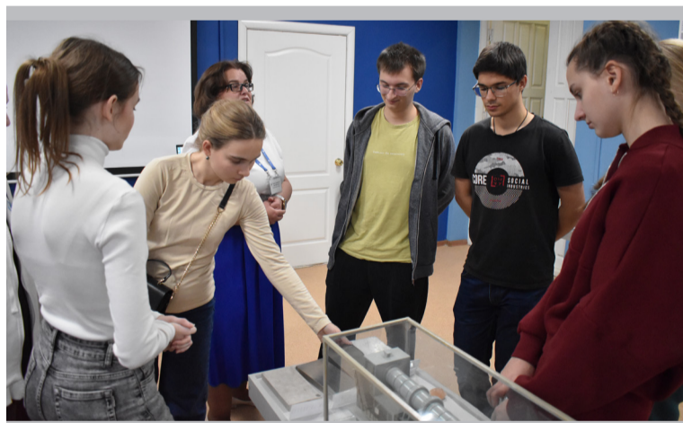
В музее студенты протестировали на знание металлов. По внешнему виду и массе образцов определили магний, алюминий, титан.

«Интересно наблюдать за живым производством, а не только изучать теорию. Меня удивило, как производственные процессы связаны между собой