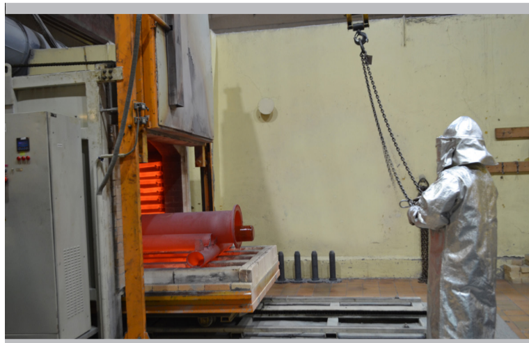
Горячее производство участка эмалирования – процесс ещё и красивый

Своим чередом идём производство участка ректификации. Голова всех технологических процессов опытного цеха – в работе безостановочно. А вот ещё одно из производственных