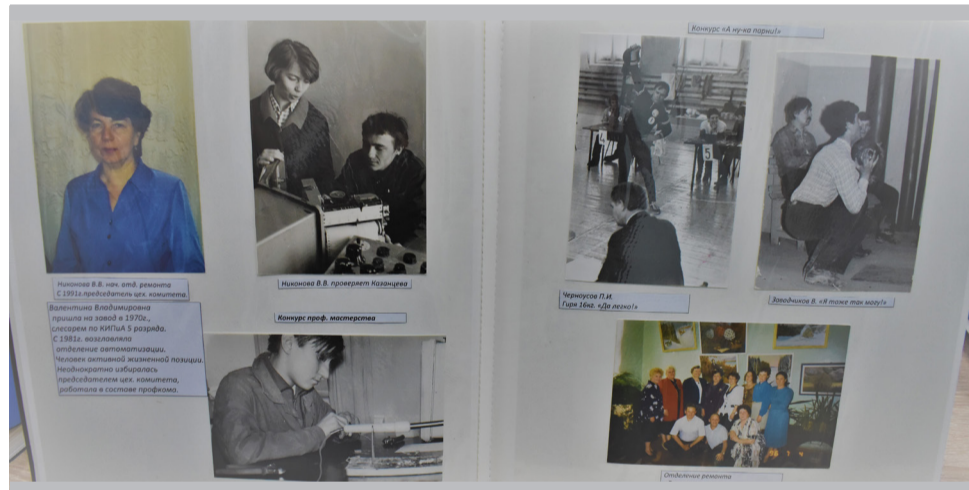
Цех № 16. Здесь тоже бережно хранят свою историю