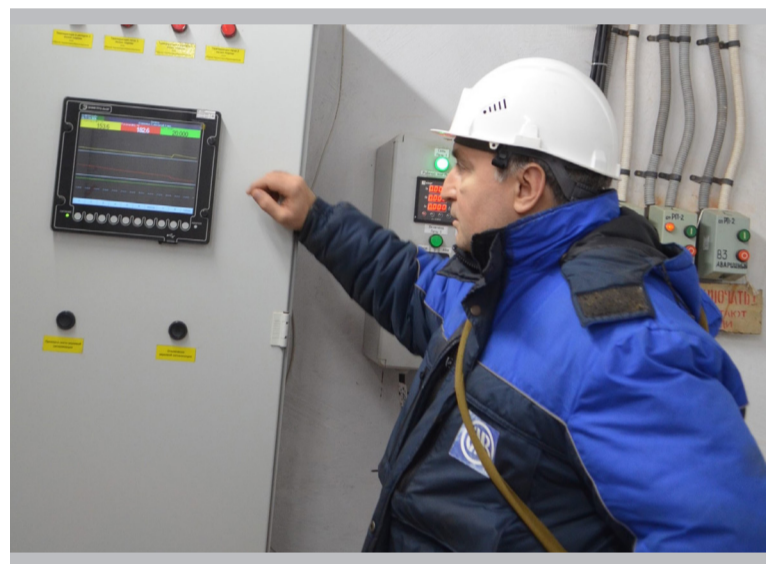
Современный прибор «Элметр» не только регистрирует температуру, но и управляет мощностью электронагрева печей