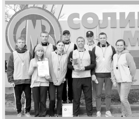
Кубок победителя вновь у металлургов цеха № 1

Ольга КРАСНИЦКАЯ.