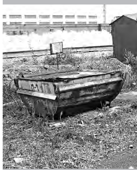
...И так стало