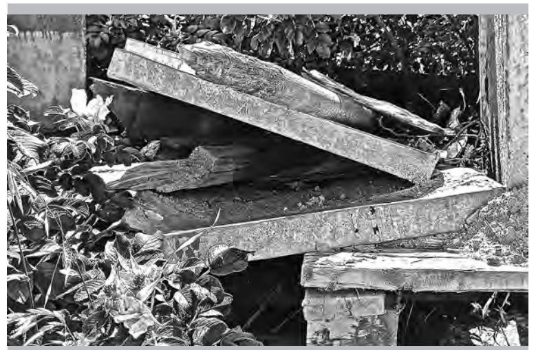
Цех № 3: хранение резервного материала