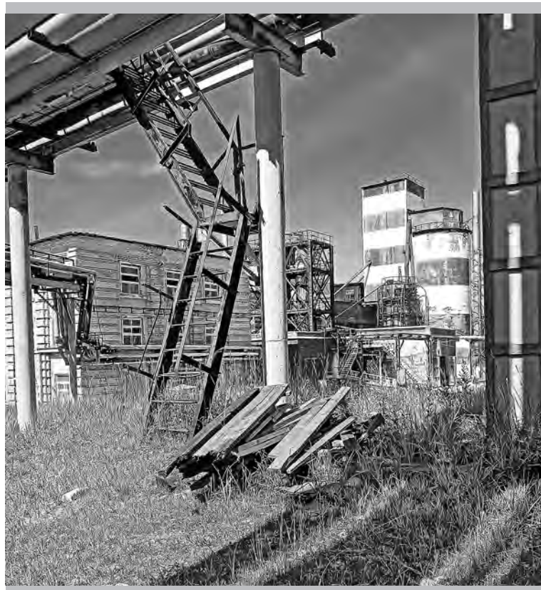
Цех № 20: под эстакадой, в районе литейного отделения