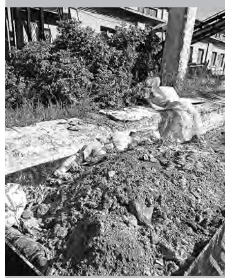
Цех № 11: все виды мусора вместе...