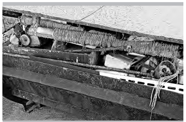
Контейнер с металлоломом, цех № 3

Елена БАЖЕНОВА. Фото автора и участников обходов