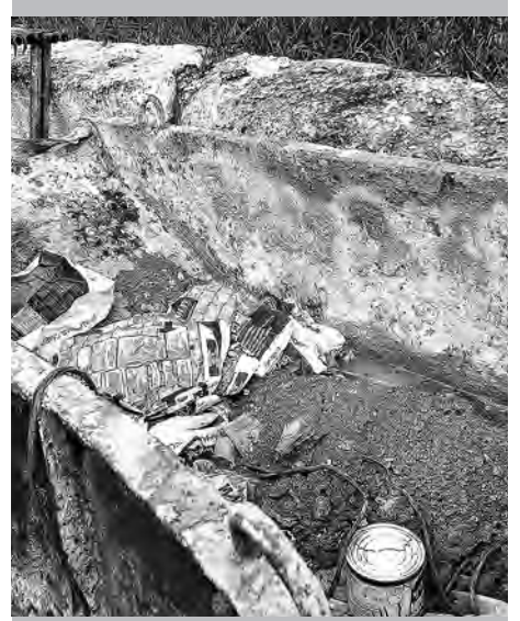
...И так стало (только строймусор)