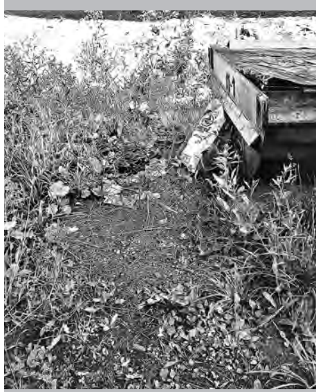
Цех № 7: так было (мусор на земле)...

Именно они-то и преобладают в списке замечаний, выявленных очередной — июльской — «серией» проверок содержания заводских территорий.