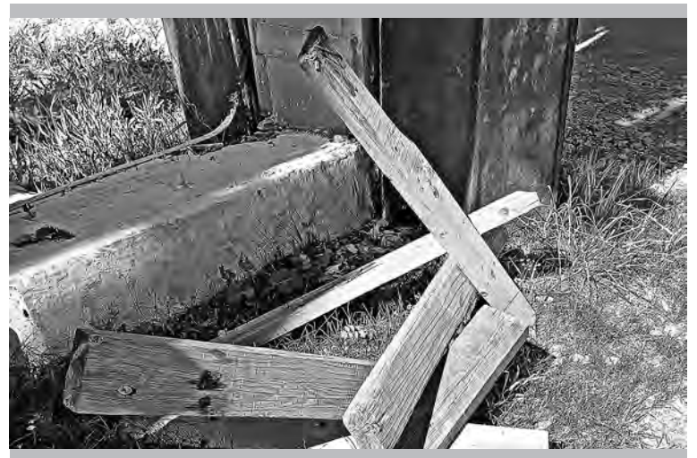
Территория цеха № 3 у лестницы, с торца здания