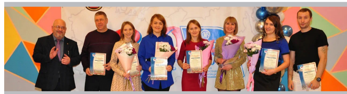
«Ваша активность вдохновляет и мотивирует! Спасибо за верность идеалам профсоюзного движения!»