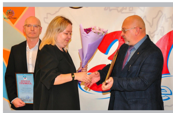
Награды от профкома СМЗ