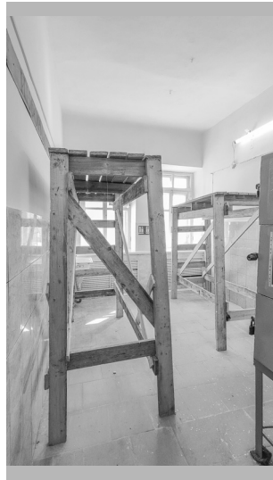
Ремонт в комнате приёма пищи цеха № 1

Вот так — шаг за шагом (как это и предписывается системой 5С), по мере собственных возможностей, что-то постепен-