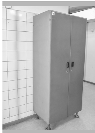
Обновлённый шкаф цеха № 16 с новыми замками и ножками

На первом фото этого мини-репортажа — один из шкафчиков, «несущих службу» в бытовых цеха КИПиА. Впервые объек-