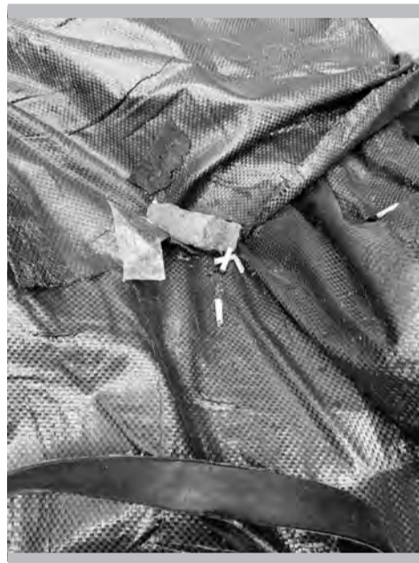
Было: короб со стройматериалами