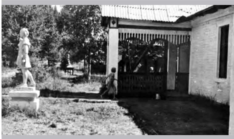
Те самые «нижние» корпуса с верандами