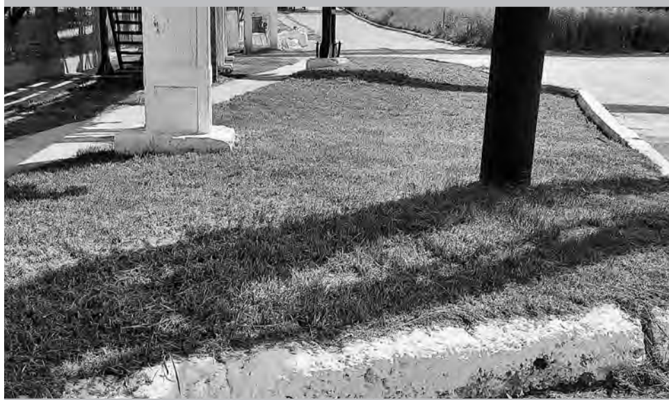
Придаться не к чему!