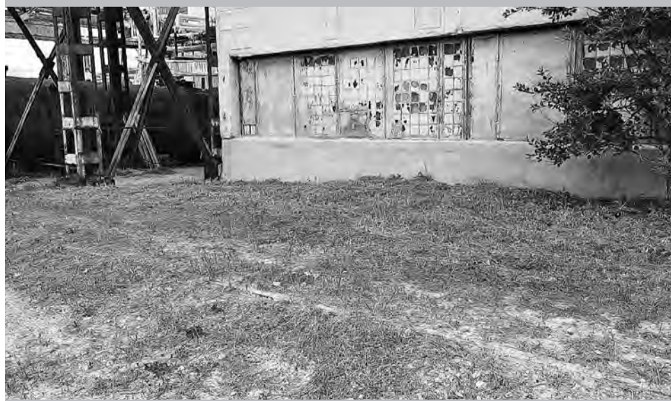
И здесь полный порядок!