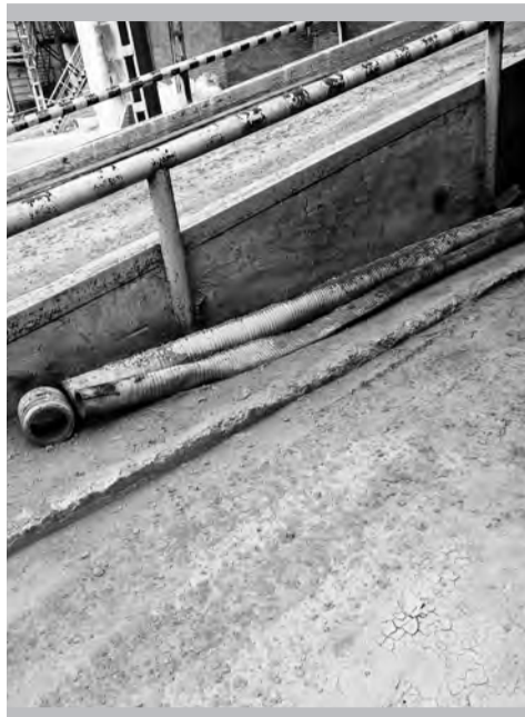
Было: цех №1, место выдувки нефтекокса

Задача сегодняшнего июньского обзора проверки состояния заводских территорий – своеобразный промежуточный анализ того, насколько результативна сама эта работа.