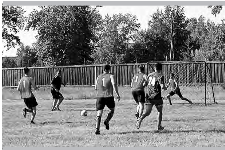
Острых моментов хватало!

Елена БАЖЕНОВА