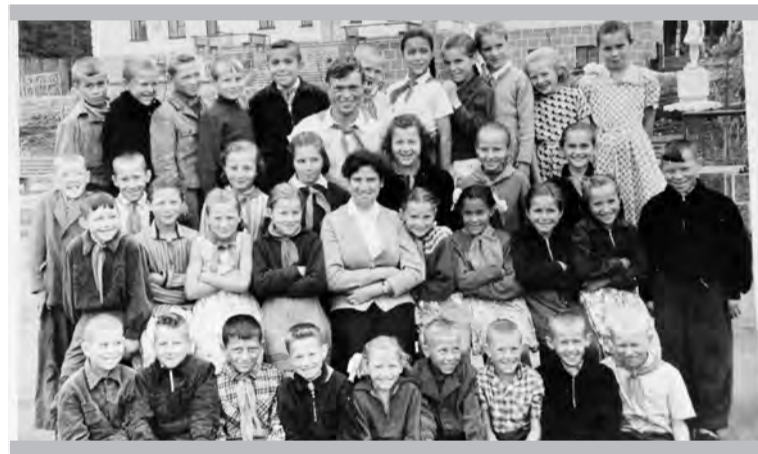
Отряды были большие и дружные

с высокой лестницей, кстати, было наше первое лагерное построение. А ещё её удобно было использовать для репетиций хора. А будущее биатлонное поле было тогда просто поляной для игр и проведения костров в дни открытия и закрытия смен.