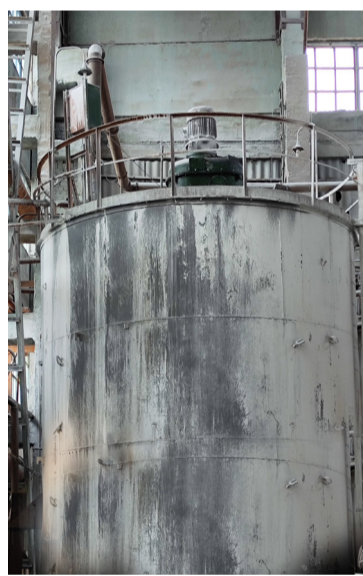
Замена мешалки известкового молока – одна из крупных работ

Среди традиционных сежегодных работ – капитальный ремонт в отделении обжига. В отчётном году, согласно плану чередования, он был большим, с заменой футеровки обжиговой печи. Параллельно с этим специалистами цеха № 26 проведена замена дымососа, центральной горелки, периферийных горелок и фурм. Причём, при монтаже нового дымососа дополнительно была смонтирована новая установка устройства плавного пуска. В период этого же останова