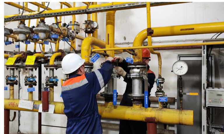
На складе хлора

Подготовила к печати Елена БАЖЕНОВА.