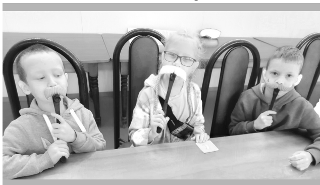
Дружные и артистичные