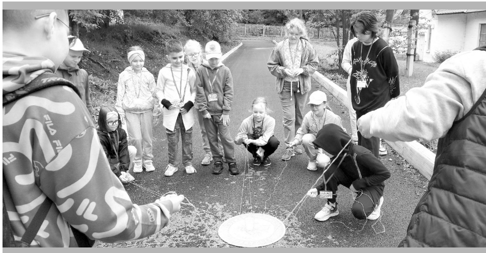
А где ещё сегодня поиграть с компанией?!

С января 2025-го года мы начнём собирать заявления родителей на новый летний сезон. Отмечу, путёвки выдаются работникам предприятия без учёта членства