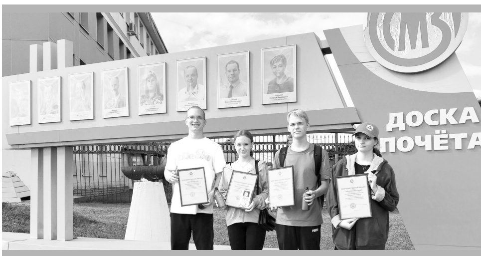
Отработали лето на Почётную грамоту!