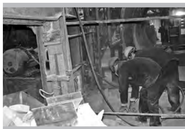
Последние демонтажные штрихи