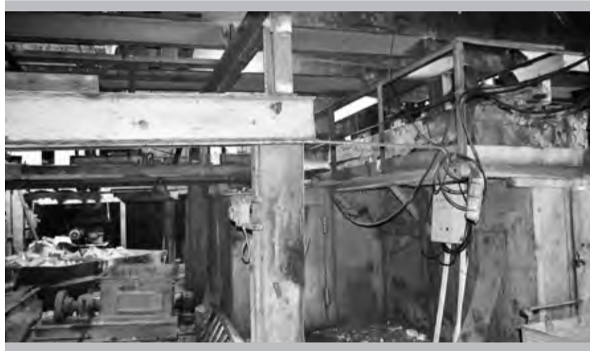
Здесь была «вращалка»

Так что нынешняя неделя получается, в прямом смысле, переходной: кто-то завершает свою задачу, а у кого на «носу» уже новый — строительный — этап.