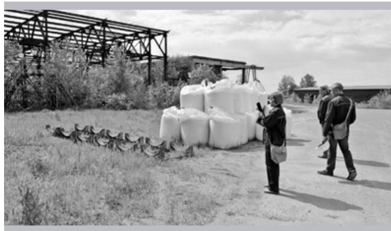
Всё «протоколирует» камера телефона

Комиссионные обходы по проверке соответствия территории предприятия установленным требованиям санитарного и природоохранного законодательства проходят с апреля по сентябрь, два раза в месяц.