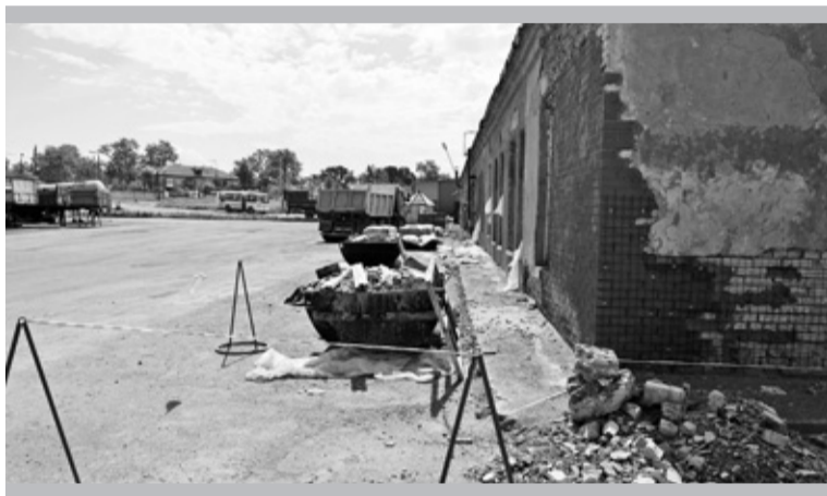
Кто будет убирать после подрядной организации?

Первым в тот день по плану БООС стал автотранспортный цех. Территории возле зданий ПТМ-1 и ПТМ-2, автозаправочного комплекса, автомойка, площадки с металлоломом тщательно