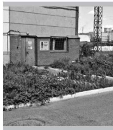
Цветочные клумбы девятого «утонули» в нескошенной траве

Трава, не скошенная своевременно, стала ещё одним замечанием. Хотя возле некоторых производственных зданий уже поработали газокосилкой. А проходя вдоль второго корпуса, мы увидели работника цеха, который занимался скосом. Так что,