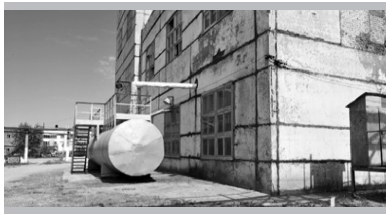
Территория отделения № 4 цеха № 7 – в порядке

Особое внимание комиссия уделила площадке, на которой хранится металлолом. Наличие твёрдого покрытия