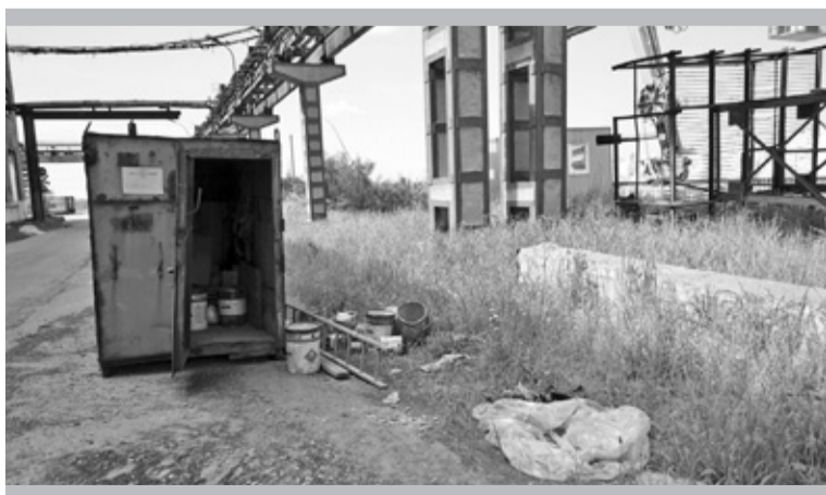
За работой подрядчиков нужен глаз да глаз

В списке замечаний «красной нитью» — навести порядок (подмести, скосить траву, заменить мусорное ведро, убрать осыпавшуюся со стен штукатурку, засыпать проливы нефтепродуктов) возле гаражей. У обоих зданий подрядчики ведут строительные работы по восстановлению фасадов,