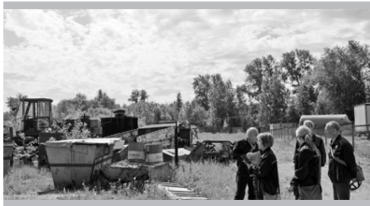
У площадки, на которой хранится металлолом, должно быть твёрдое покрытие

Более долгим был обход по территории цеха номер семь. У этого подразделения проверяющие отметили плюсы. В целом территория ухожена, все бордюры побелены, кра-