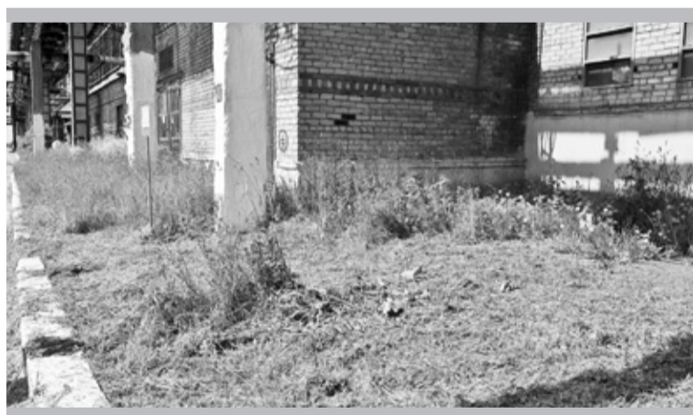
Скос травы возле первого и второго отделений уже начался

Навести порядок необходимо на площадке для хра-