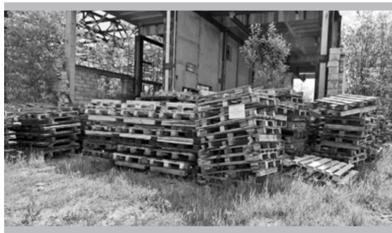
Поддоны цеха № 7 аккуратно уложены и подписаны!