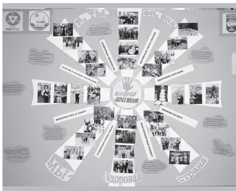
Тематический стенд цеха № 10